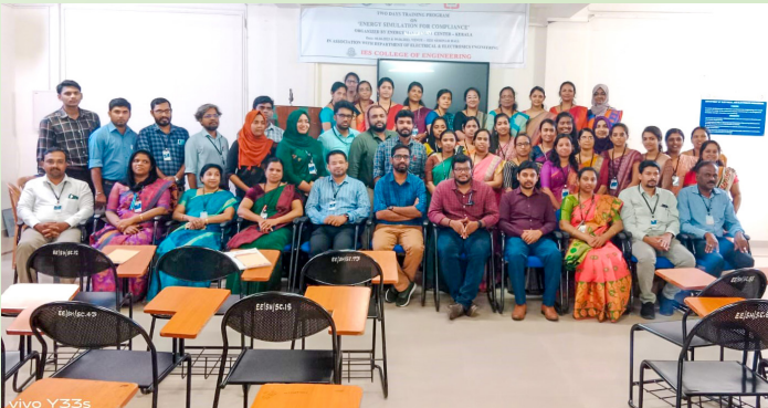
തൃശൂർ ഐ.ഇ.എസ്. കോളേജ് ഓഫ് എഞ്ചിനീയറിംഗിൽ നടന്ന പരിശീലനം