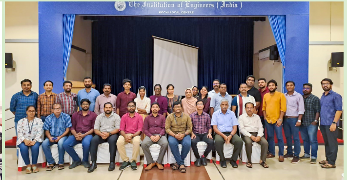
ഇൻസ്റ്റിറ്റ്യൂഷൻ ഓഫ് എഞ്ചിനീയേഴ്സ് ഇന്ത്യ കൊച്ചി ലോക്കൽ ചാപ്റ്ററിൽ നടന്ന പരിശീലനം