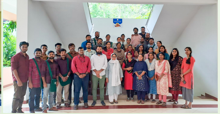
പാലക്കാട് വാവന്തൂർ ശ്രീപതി ഇൻസ്റ്റിറ്റ്യൂട്ട് ഓഫ് മാനേജ്മെന്റ് ആൻഡ് ടെക്നോളജിയിൽ നടന്ന പരിശീലനം