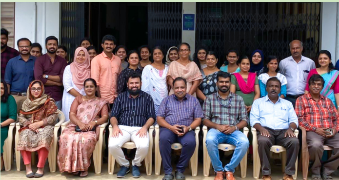
തൃശൂർ ഗവണ്മെന്റ് എഞ്ചിനീയറിംഗ് കോളേജിൽ നടന്ന പരിശീലനം