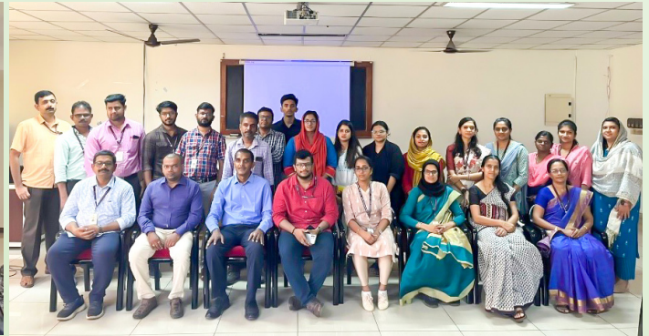
കല്ലിപ്പുറം എം.ഇ.എസ്. കോളേജ് ഓഫ് എഞ്ചിനീയറിംഗിൽ നടന്ന പരിശീലനം