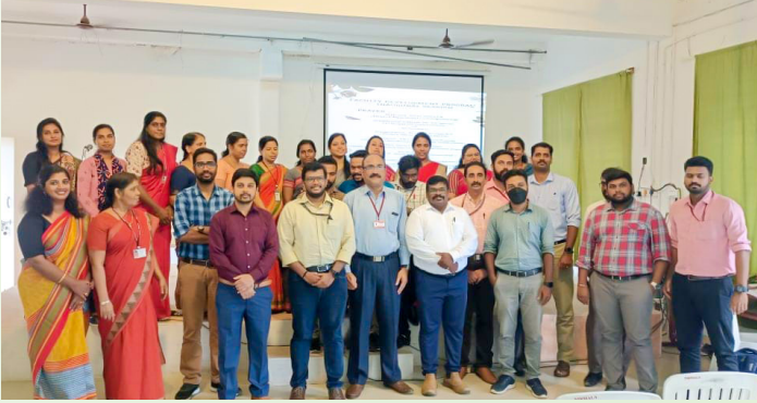
ഇരിങ്ങാലക്കുടയിലെ നിർമ്മല കോളേജ് ഓഫ് എഞ്ചിനീയറിംഗിൽ നടന്ന പരിശീലനം