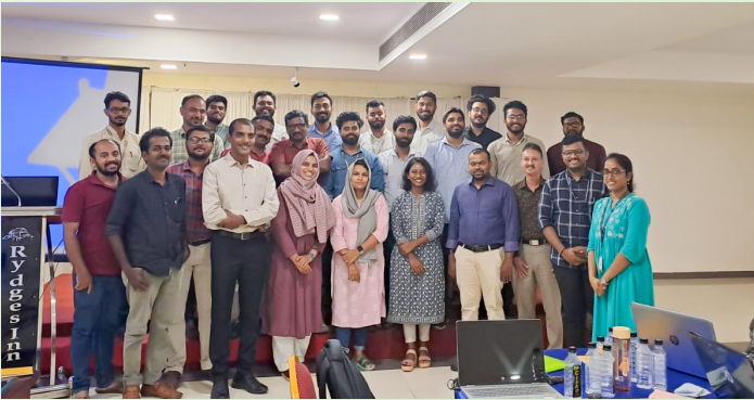
മലപ്പുറം കോട്ടക്കലിലെ ഹോട്ടൽ റിഡ്ജസ് ഇൻ-ൽ നടന്ന പരിശീലനം