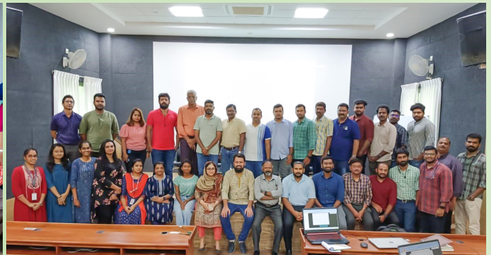
തിരുവനന്തപുരം എനർജി മാനേജ്മെന്റ് സെന്ററിൽ നടന്ന പരിശീലനം